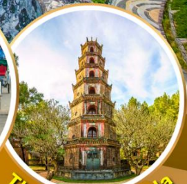
Thien Mu Pagoda