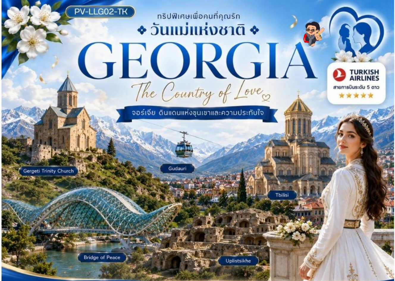
Gergeti Trinity Church