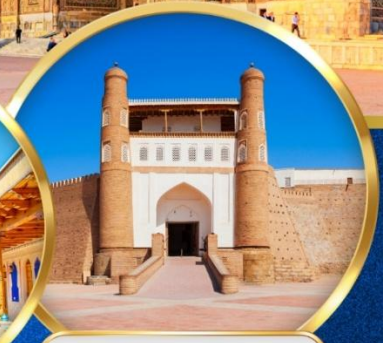
THE ARK FORTRESS

น้ำหนักกระเป๋า 23 กิโล พักโรงแรม 4 ดาว รวมประกันเดินทาง อาหาร 19 มื้อ ราคารวมวีซ่า